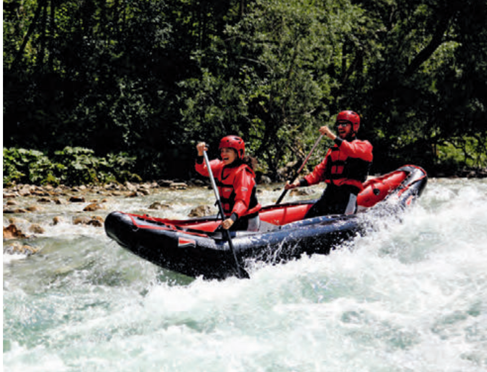
Der Rohstoff Kautschuk ist nicht nur nachhaltig – er ermöglicht auch den Bau robuster Boote mit hoher Lebensdauer.

Ich bin nach dem 2. Weltkrieg aufgewachsen. Da gab es keinen Luxus. Außerhalb der Schule habe ich mich während allen Jahreszeiten ausschließlich in der Natur aufgehalten. Da ist ein unauslöschlicher Bezug zur Natur und Umwelt entstanden und bis heute geblieben. Als Jugendlicher habe ich mit Freunden naheliegende Bäche von Unrat entrümpelt. Später mit dem Raftingboot auch Flüsse. So habe ich schon früher den ökologischen Fußabdruck positiv beeinflusst. Deshalb gab es für mich