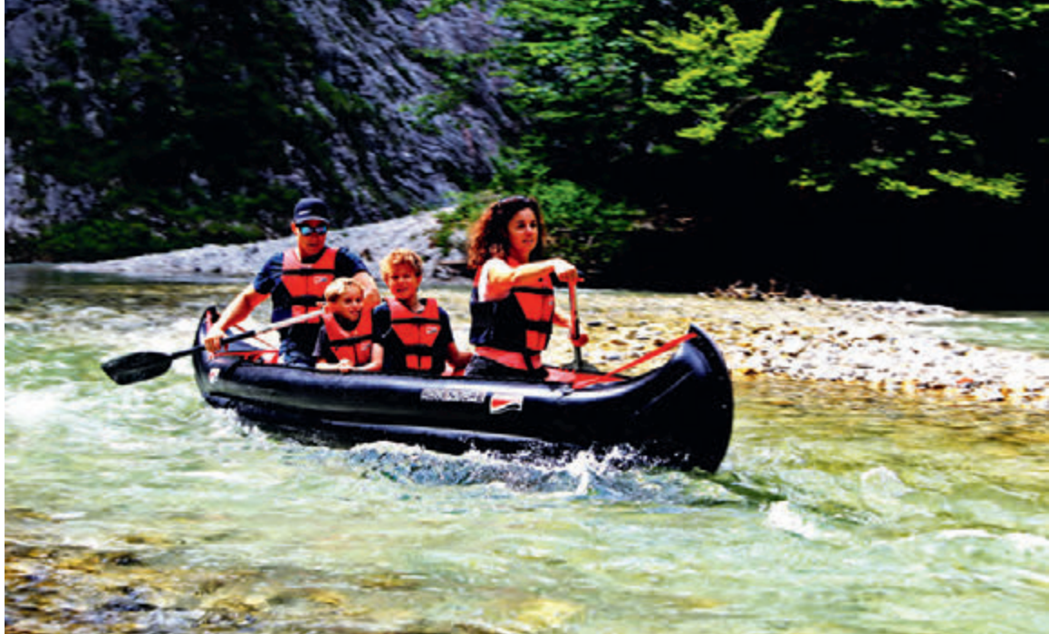
Umweltfreundlicher Transport mit öffentlichen Verkehrsmitteln, platzsparend im Auto (Bilder unten) – und dann passt in manche Grabner-Boote doch eine Familie mit zwei Kindern.